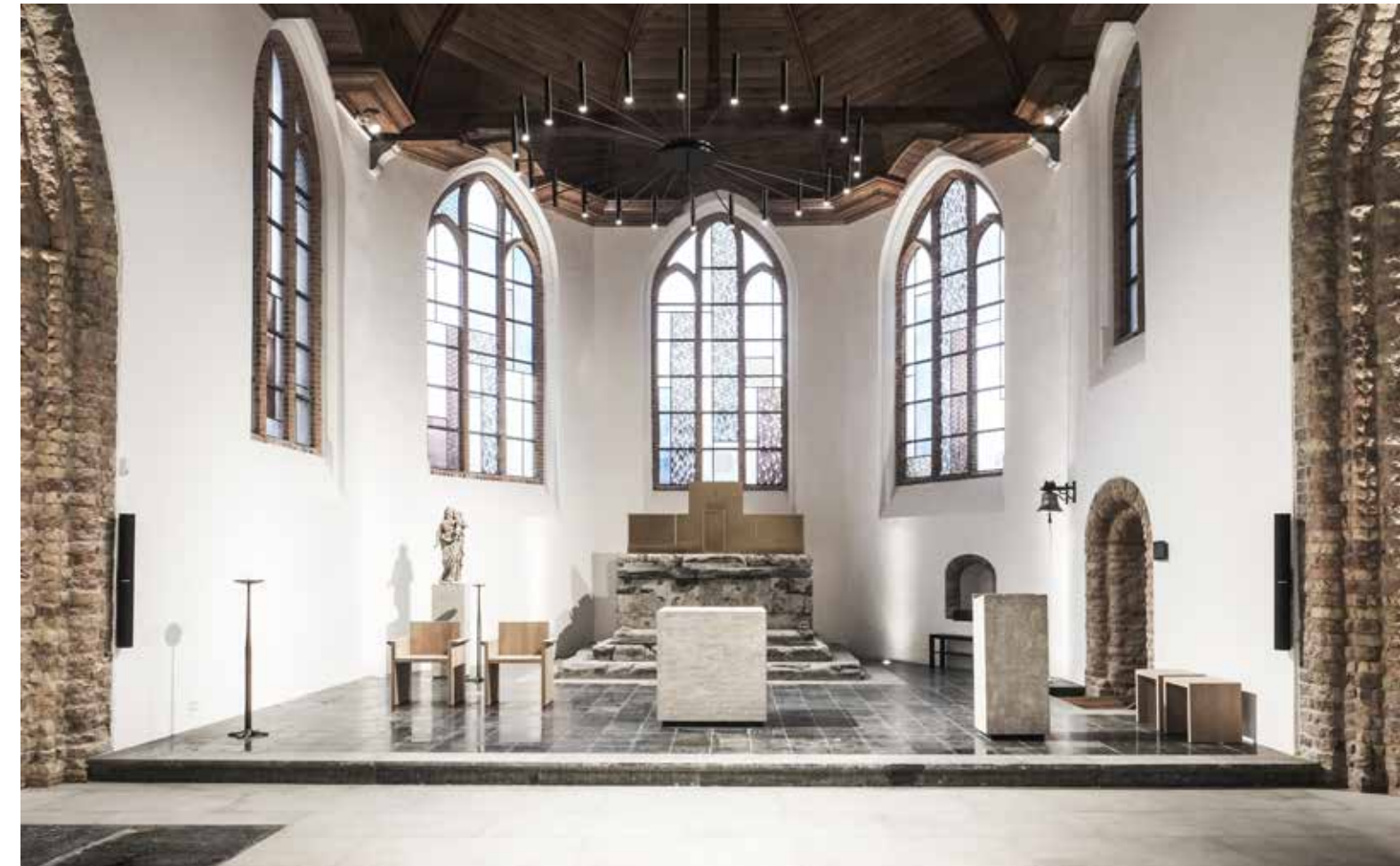
Het sacrale gedeelte is haast volledig gerestaureerd.

“Gelovigen kunnen nog steeds terecht in een intieme geloofsruimte, maar er is ook een polyvalente zone voor sociale en culturele activiteiten en evenementen ingericht”