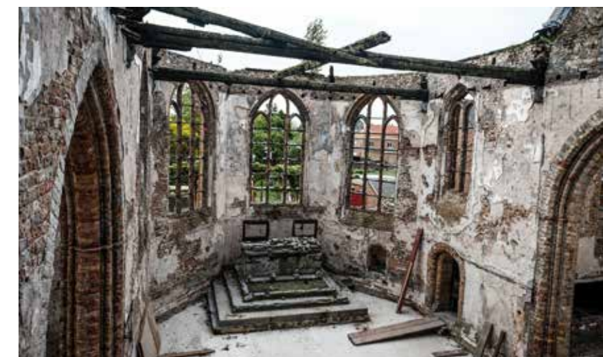
Vooraf op het vlak van stabiliteit had de verwoestende brand ernstige implicaties.

“Wat de Sint-Niklaaskerk eens zo speciaal maakte, is dat ze was afgebrand. Dat is helemaal anders dan een kerk die erop achteruitgegaan is door ouderdom of verloederding”