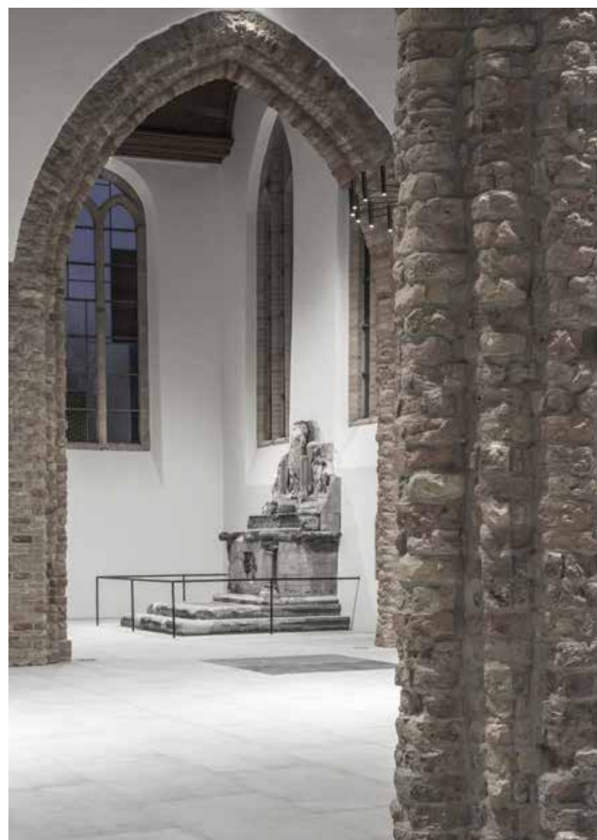
Een van de moeilijkheden was de slechte staat van de bakstenen. De aangetaste kolommen en het geteisterde metselwerk zijn geïnjecteerd met epoxyhars.