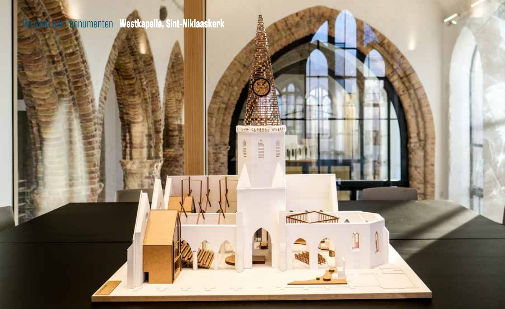
De maquette van de Sint-Niklaaskerk is uitgesteld in een van de nieuwe vergaderzalen.