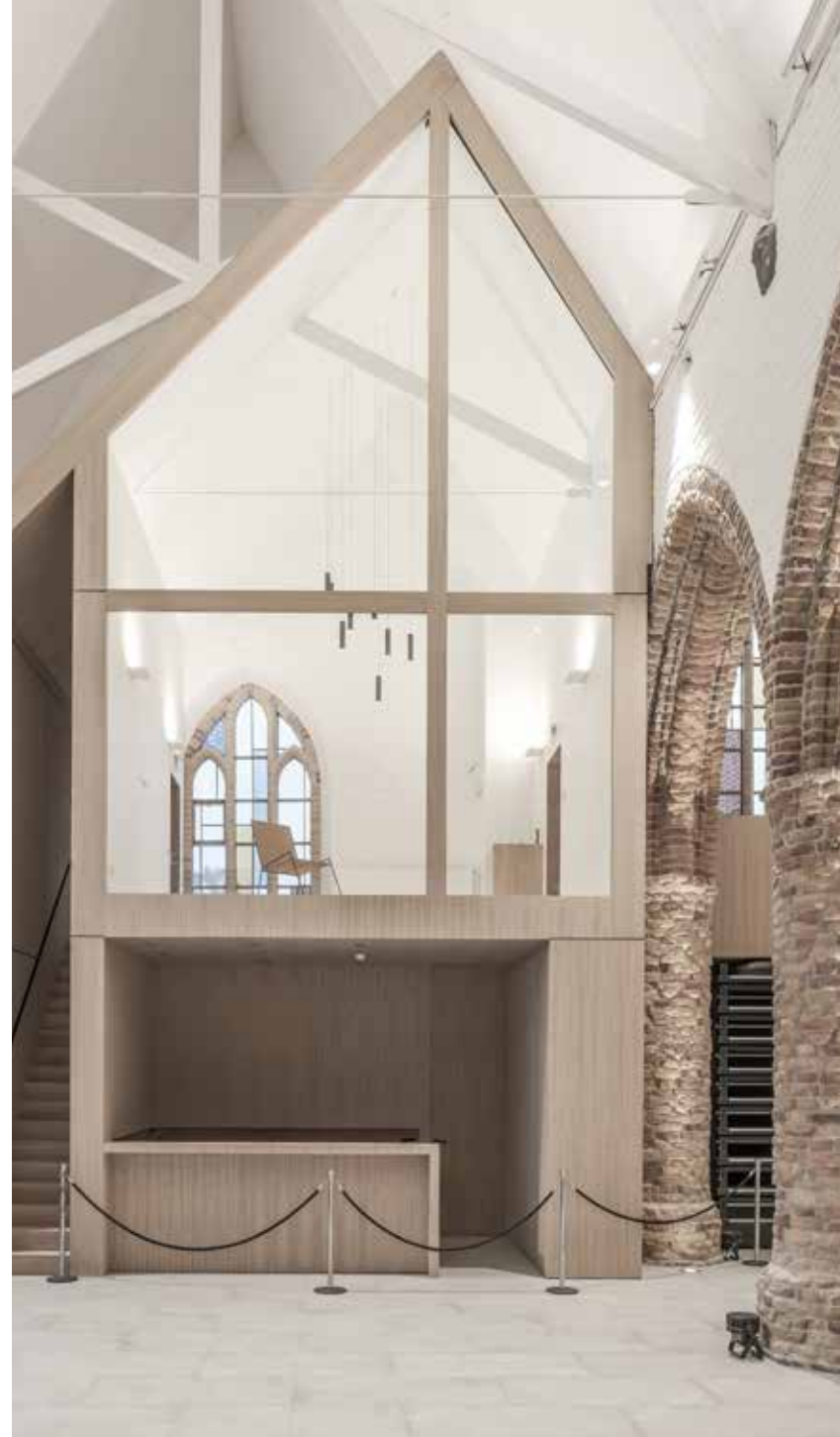
In het evenementengedeelte zijn twee box-in-boxruimtes met een bar en vergaderzalen gerealiseerd.