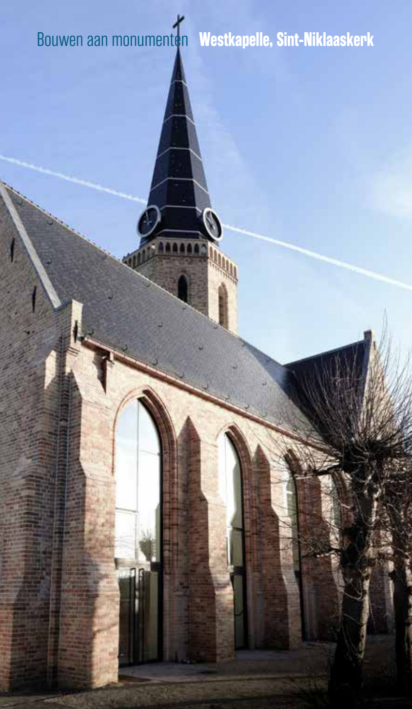
Na de intensieve restauratie en renovatie is de Sint-Niklaaskerk meer dan ooit het kloppend hart van Westkapelle.