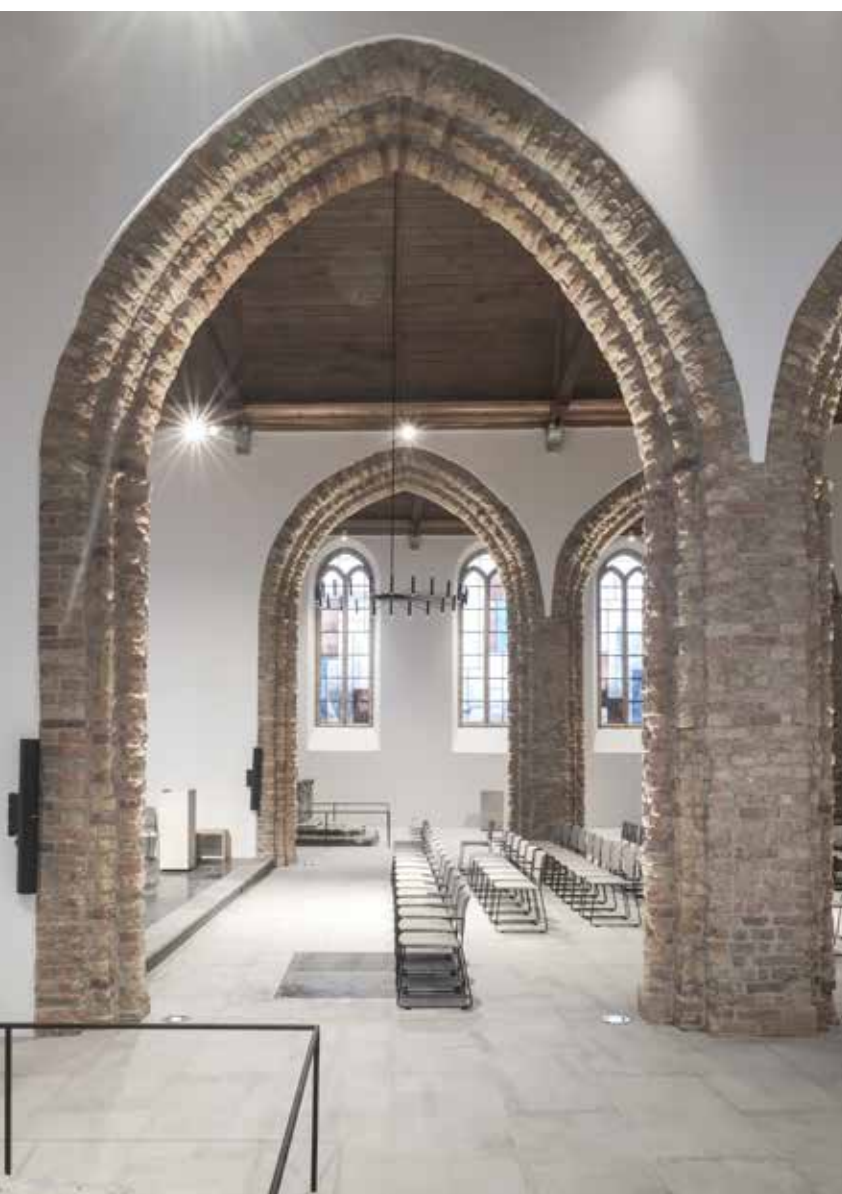
Dankzij de ruïneuze uitstraling van de bestaande structuren is de impact van de brand nog steeds voelbaar in de kerk.

Tekst Tim Janssens